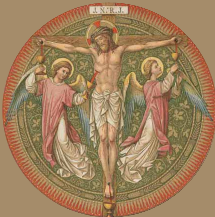
Ilustracije: MISSALE ROMANUM MDCCCII